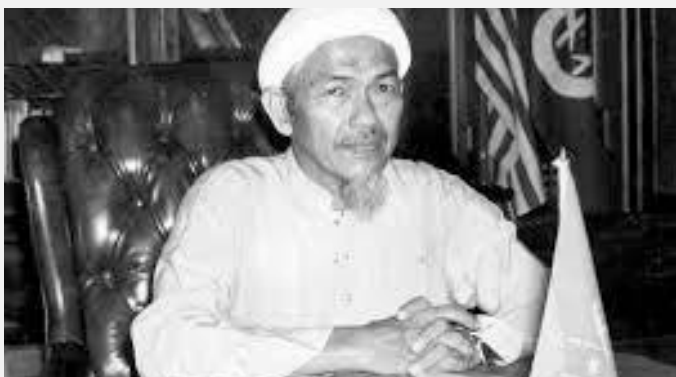
Tok Guru di pejabat Menteri Besar

Tok Guru dilantik menjadi Menteri Besar yang kelima pada 21 Oktober 1990 selepas Angkatan Perpaduan Ummah (APU) memenangi kesemua 39 kerusi DUN. Apa yang menjadi panduan pentadbiran negeri Kelantan sehingga kini adalah pemikiran beliau sepanjang 23 tahun menjadi Menteri Besar Kelantan. Pentadbiran negeri Kelantan berasaskan dasar Membangun Bersama Islam bertunjangkan 'Ubudiyyah, Mas'uliyah dan Itqan .