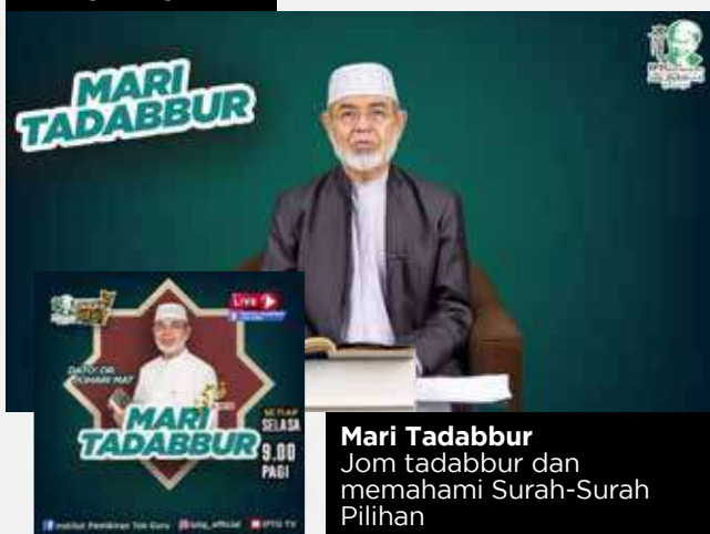
Mari Tadabbur Jom tadabbur dan memahami Surah-Surah Pilihan