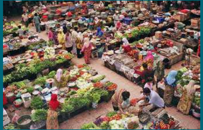
Pasar Siti Khadijah - Kota Bharu

Menurut perspektif Islam, kemakmuran ialah kejayaan atau keberhasilan. Ini kerana ia disandarkan dengan kalimah al-Falah dalam buku An Introduction to Islamic Economics yang dihasilkan oleh Muhammad Akram Khan (1994). Al-Falah merupakan konsep yang komprehensif dan mencakupi keseluruhan aspek kehidupan manusia. Terdapat 40 tempat kalimah al-Falah dalam al-Quran. Antara ciri-ciri yang terdapat dalam sesebuah negeri yang makmur ialah suasana yang aman, wujudnya keadilan dan cakna terhadap sosioekonomi rakyat.