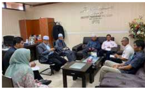
Kunjungan hormat alumni Universiti Islam Madinah ke Institut Pemikiran Tok Guru Dato' Bentara Setia (IPTG).