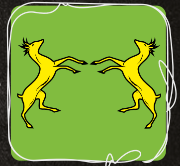
Kijang Tanda Ingatan Kepada Che Siti Wan Kembang Pemerintah Kelantan Yang Menyukai Kijang