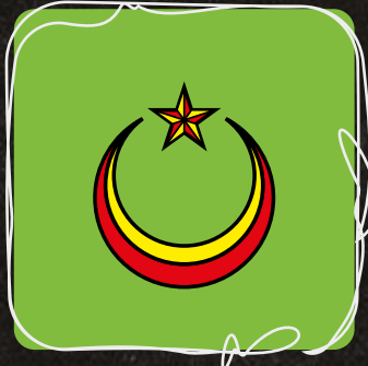
Bulan & Bintang Islam Agama Rasmi Kelantan