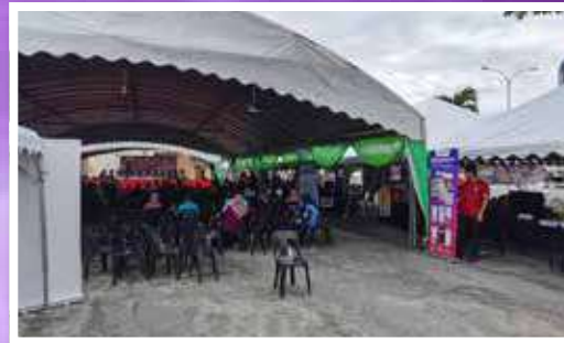
Pameran Galeri Tok Guru di Dewan Terbuka Kompleks Sukan Majlis Daerah Dabong, Kuala Krai bersempena Program Cakna Rakyat Dun Dabong.