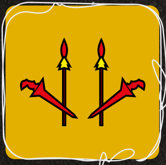
Keris & Lembing Kekuatan Orang Melayu Kelantan