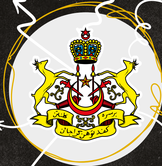
Gendang Bersedia Mempertahan Diri Dari Sebarang Ancaman