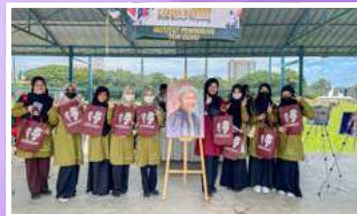
Pameran Galeri Tok Guru di Dataran Wisma Purnama, Pengkalan Chepa bersempena Program Cakna Rakyat Dun Pengkalan Chepa.