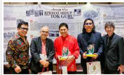
Pameran Galeri Tok Guru bersempena Majlis Malam Selebriti & Anak Seni bersama Pimpinan Kerajaan Negeri Kelantan telah diadakan di Hotel Le Meridien, Putrajaya.