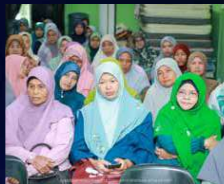
29 Safar 1444H / 26 September 2022 (Isnin) DUN Dabong

Masa : 8.00 pagi – 1.00 tengahari Tempat : Bilik Mesyuarat Surau Hijau Gua Ikan, Dabong Peserta : 100 orang