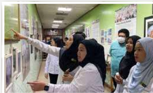
Pameran Tok Guru sempena Karnival Anak Kelantan di Perantauan 2022 bertempat di Bangi Convention Centre.