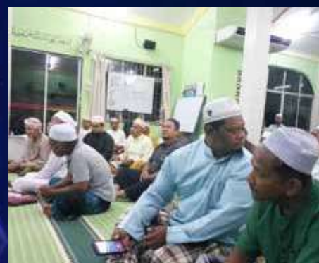
30 Safar 1444H / 27 September 2022 (Selasa) DUN Jelawat

Masa : 9.00 malam – 11.00 malam Tempat : Masjid Panchor Jelawat Peserta : 150 orang