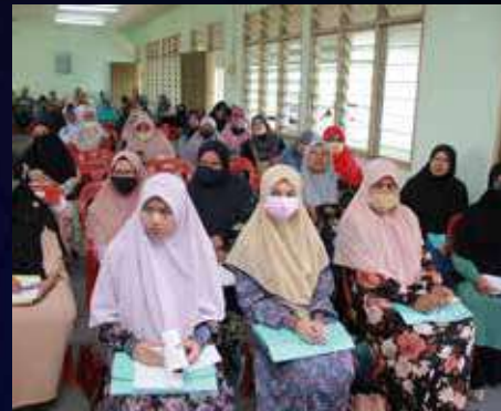
22 Muharam 1444H / 20 Ogos 2022 (Sabtu) DUN Kok Lanas

Masa : 8.00 pagi – 1.00 tengahari Tempat : Dewan Akademi Kepimpinan Pemuda Kok Lanas Peserta : 120 orang