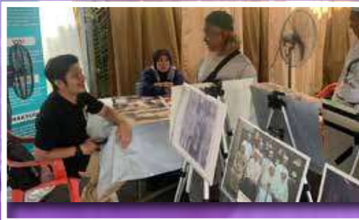
Pameran Tok Guru sempena Karnival Cakna Rakyat "Semerak di Hati" yang diadakan di Dataran Bahtera, Tok Bali.