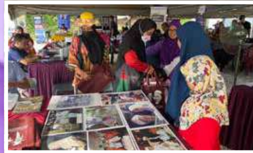
Pemikiran Keamanan dan Kesejahteraan Insan, Fakulti Pengajian Bahasa dan Pembangunan Insan dan Institut Pemikiran Tok Guru (IPTG) mengadakan sesi perbincangan susulan berkenaan Penyediaan Model Pemikiran Tok Guru di Bilik Mesyuarat Tok Kenali, FBI UMK Bachok.