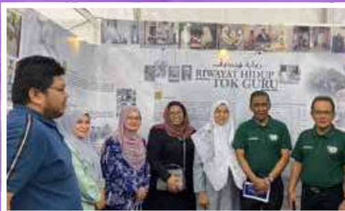
Pameran Tok Guru di Pasar Tok Kenali, Simpang 4 Binjai bersempena Program Cakna Rakyat Dun Demit.

13-15 OKTOBER 2022 16-17 RABIUL AWAL 1444H