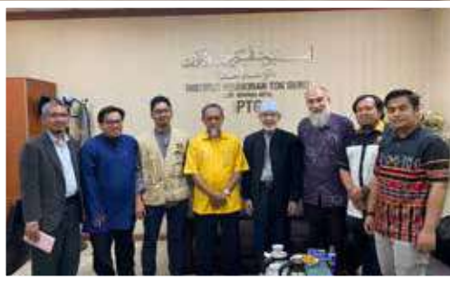
Kunjungan hormat Pusat Pemikiran Keamanan dan Kesejahteraan Insan (PEMIKIR), Fakulti Pengajian Bahasa Dan Pembangunan Insan, Universiti Malaysia Kelantan (UMK) ke Institut Pemikiran Tok Guru Dato' Bentara Setia (IPTG).