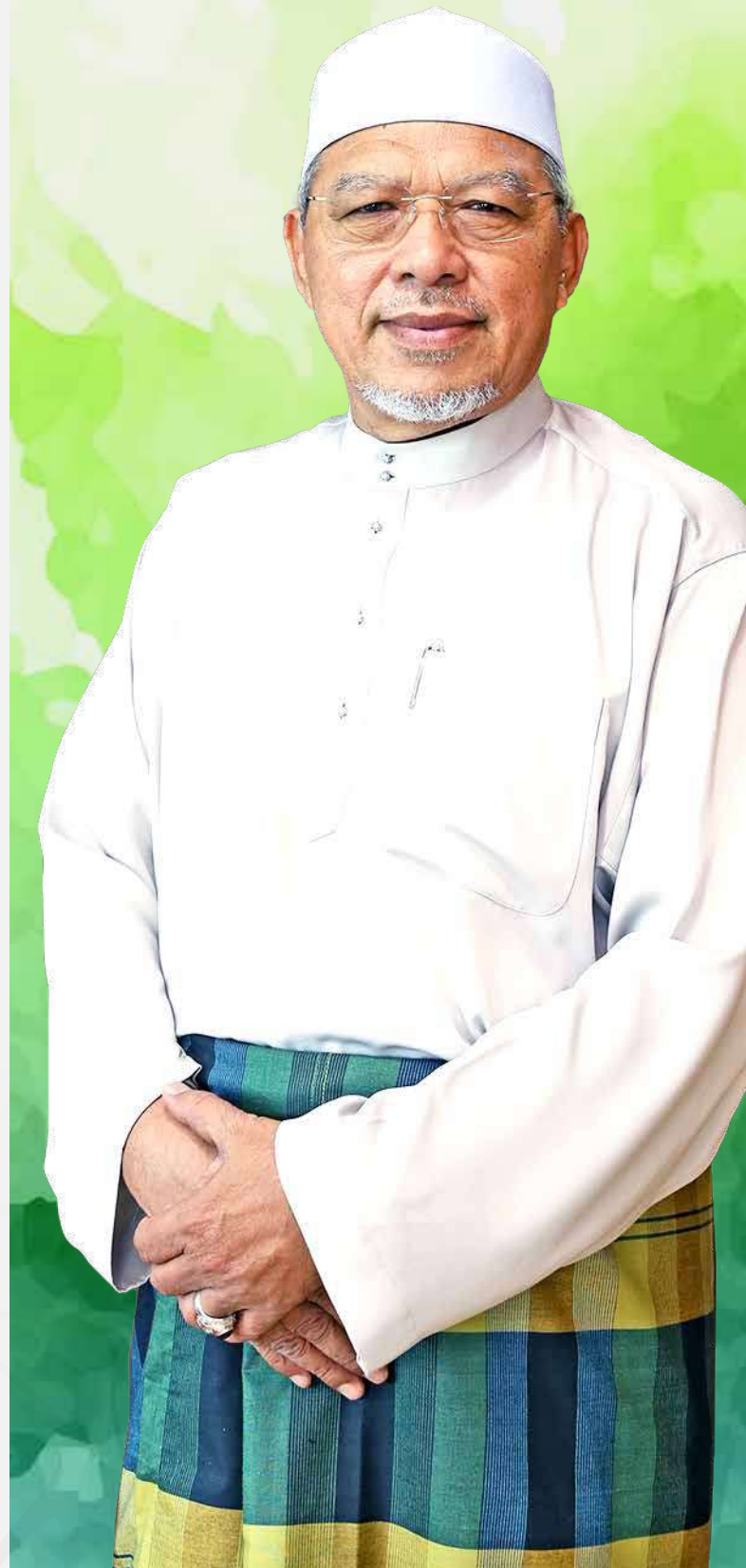
YAB Ustaz Dato' Bentara Kanan Haji Ahmad bin Yakob Menteri Besar Negeri Kelantan

Raja Berdaulat, Rakyat Muafakat, Negeri Berkat 'Merakyat Membangun Bersama Islam - Keberkatan, Kemakmuran, Kebajikan'