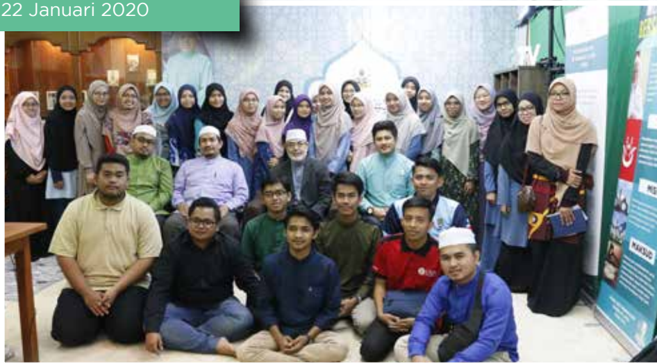
Gabungan Mahasiswa Islam Se-Malaysia (GAMIS)