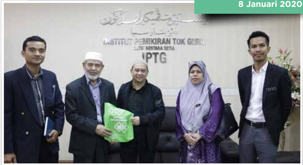
Kunjungan Hormat Dewan Bahasa Pustaka