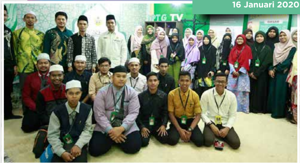
Lawatan Peserta Generasi Sejahtera Kelantan (GENTERA)