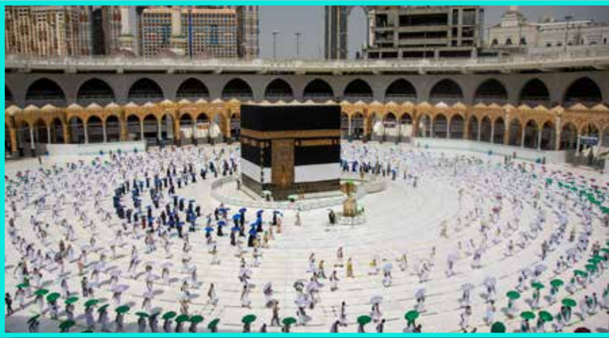
Suasana di Kaabah Ketika Musim Haji tahun 2020 dengan penjarakkan sosial dan bilangan kemasukkan jemaah yang terhad

Allah SWT berfirman di dalam surah al-Baqarah: 91 yang bermaksud: