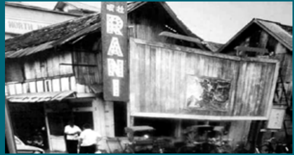
Rani Cinema, Jalan Tok Hakim - Kota Bharu, Kelantan 1950