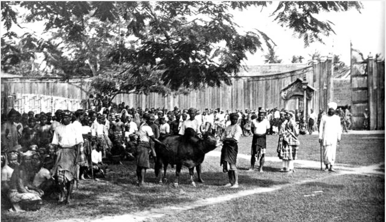
Persediaan Laga Lembu - Kota Bharu, Kelantan, 1902