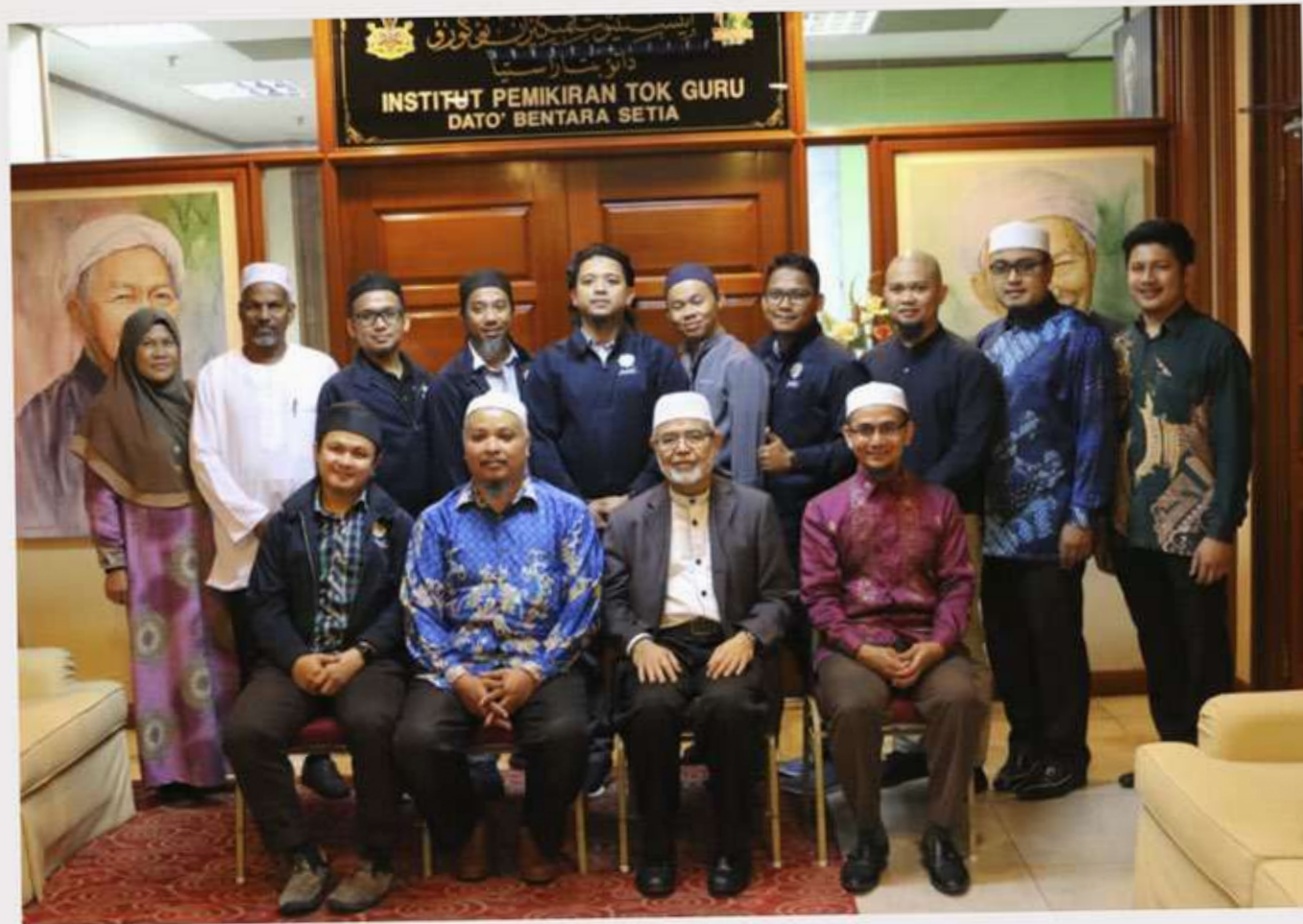
18 Syaaban 1440H / 24 April 2019 Wakil rombongan daripada Pertubuhan Pembangunan Pendidikan Islam Sabah (PISA) & Badan Kebajikan Petronas Labuan sempat singgah ke IPTG bersempena lawatan mereka Ke Kelantan.