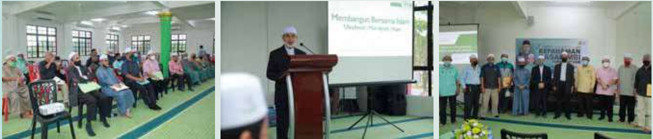
07 Rejab 1443H / 09 Februari 2022 Dun Gual Perioik

Unit Latihan telah mengadakan Kursus Kefahaman Dasar Membangun Bersama Islam (MBI) Peringkat Dun kepada 9 buah dun sepanjang bulan Februari hingga Mac, antaranya ialah: