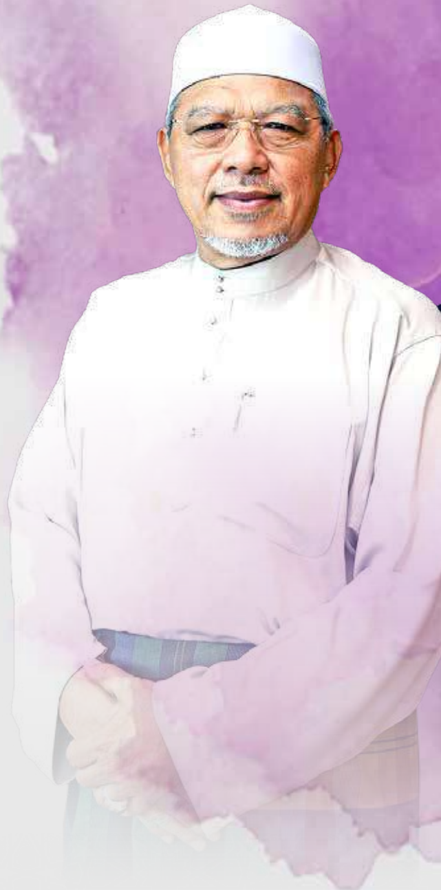
YAB Ustaz Dato’ Bentara Kanan Dato’ Haji Ahmad bin Yakob Menteri Besar Negeri Kelantan

*MEMBANGUN BERSAMA ISLAM - KELANTAN MENERAJUI PERUBAHAN*