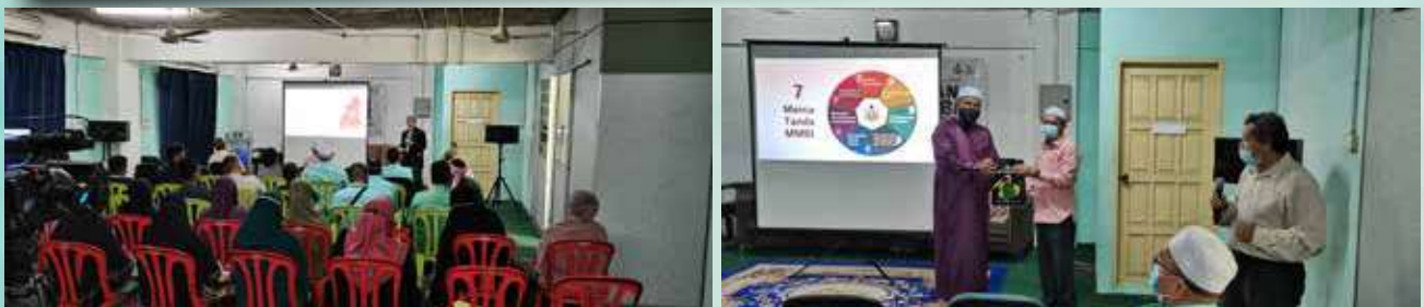
11 Rejab 1443H / 13 Februari 2022 Dun Salor