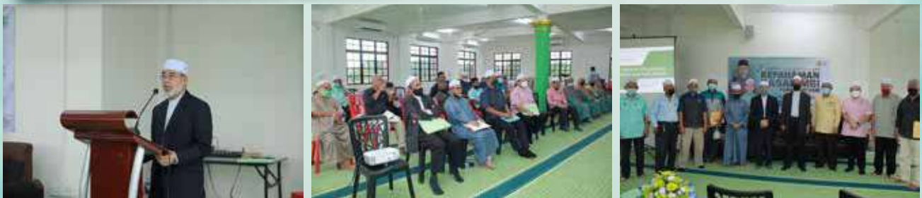
10 Rejab 1443H / 12 Februari 2022 Dun Nengiri