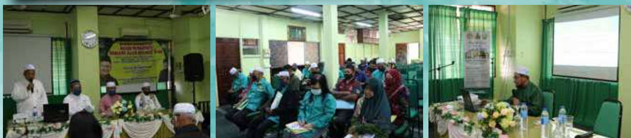
16 Syaaban 1443H / 19 Mac 2022 Dun Gual Ipoh