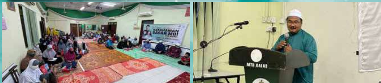
05 Syaaban 1443H / 08 Mac 2022 Dun Galas