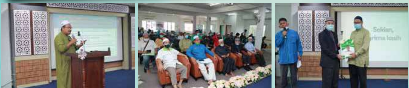
21 Rejab 2022 / 23 Februari 2022 Dun Wakaf Bharu