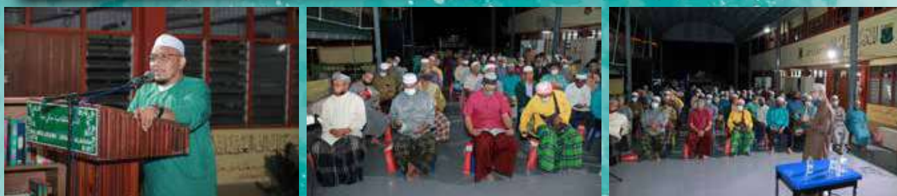
12 Syaaban 1443H / 15 Mac 2022 Dun Manek Urai