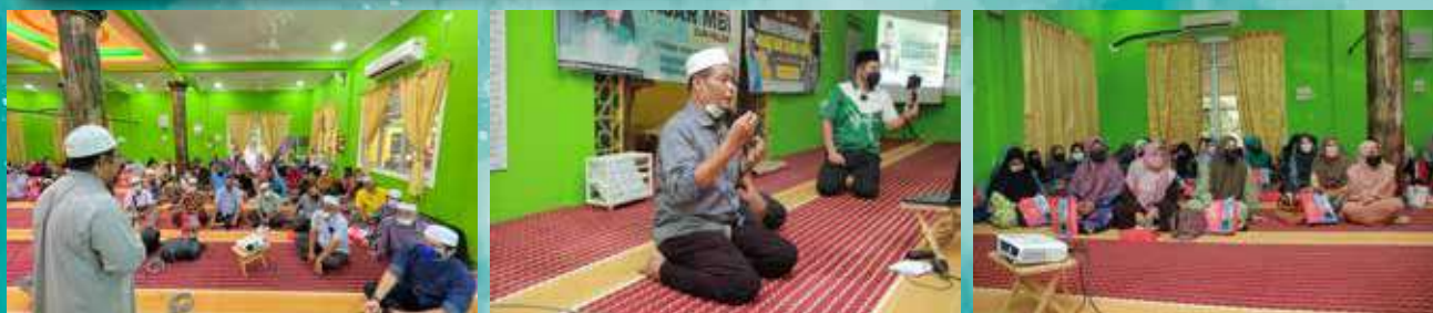
05 Syaaban 1443H / 08 Mac 2022 Dun Paloh