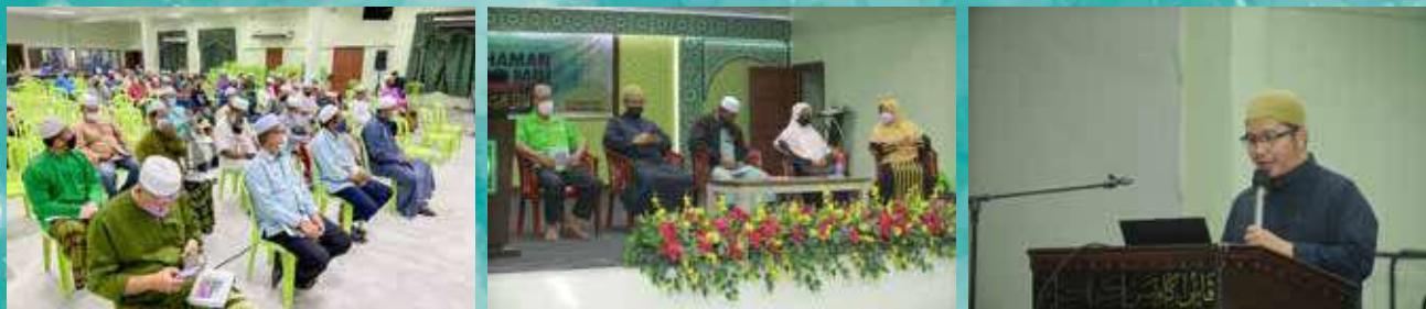
03 Syaaban 1443H / 06 Mac 2022 Dun Mengkebang